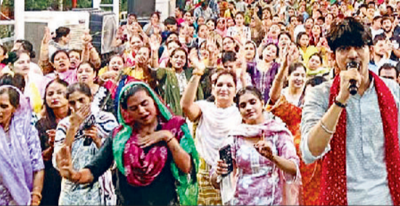
सिरसा। श्याम बगीची में भजनों की प्रस्तुति देते गायक।