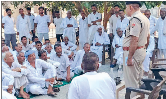
रतिया। लोगों को नशे के खिलाफ जागरूक करती जिला पुलिस की नशामुक्ति टीम व ग्रामीणों को नशे के खिलाफ जागरूक करते थाना प्रभारी।

व्यक्तिगत काउंसलिंग की गई। इसके उपरांत उन्हें स्वास्थ्य के प्रति जागरूक करते हुए होम्योपैथिक व आयुर्वेदिक चिकित्सा सेवाएं भी प्रदान की गईं। फतेहाबाद पुलिस द्वारा चलाया जा रहा यह अभियान समाज को नशा मुक्त बनाने की दिशा में एक सारानीय पहल है। नशा न केवल व्यक्ति को शारीरिक और मानसिक रूप से कमजोर करता है, बल्कि उसके परिवार और समाज को भी प्रभावित करता है। यह अभियान केवल उपचार तक सीमित नहीं, बल्कि समाज में नशे के विरुद्ध चेतना जागृत करने का भी कार्य कर रहा है।