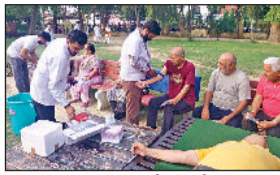
सिरसा। शिविर में मरीजों की जांच करते हुए चिकित्सक।