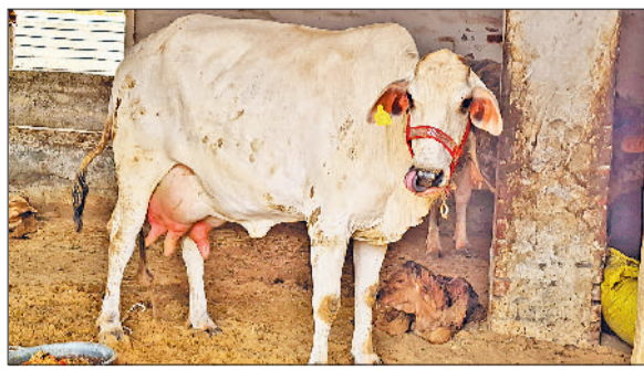
सिरसा। थारपारकर नस्ल की गाय।