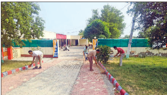
फतेहाबाद। पुलिस थानों में स्वच्छता अभियान चलाकर श्रमदान करते पुलिस कर्मचारियों।