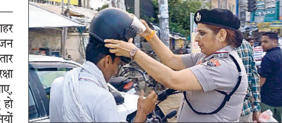
मोबाइल फोन का इस्तेमाल न करें क्योंकि आपकी थोड़ी सी लापरवाही से किसी की जान जोखिम में जा सकती है। उपस्थिति लोगों से कहा कि सबसे ज्यादा दुर्घटनाएं

महिला थाना इंचार्ज ने रविवार को शहर सिरसा व अन्य जगहों पर पहुंचकर आमजन को सड़क सुरक्षा नियमों के बारे में विस्तार से जानकारी देते हुए कहा कि सड़क सुरक्षा के अन्तर्गत तेज गति से वाहन न चलाए, क्योंकि ऐसा करने से अक्सर दुर्घटनाएं हो जाती हैं और परिवार को काफ़ी परेशानियों का सामना करना पड़ता है। उन्होंने कहा कि दुपहिया या चौपहिया वाहन चलाते समय