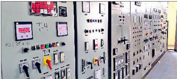
फतेहाबाद। 33 केवी सब स्टेशन में ओवरलोड मशीनरी।

जून माह में इस बार अब तक प्री मानसून की बरसात न होने का सीधा असर बिजली आपूर्ति पर पड़ा है। जून मास में बिजली आपूर्ति की डिमांड एकदम से 7 करोड़ यूनिट बढ़ गई। यही कारण है कि विद्युत निगम को गांवों को छोड़िए, शहरों में भी बिजली के अघोषित कट लगाने पड़ रहे हैं। इतना ही नहीं, रात के समय तो हालात और भी खराब हो जाते हैं। रात के समय बिजली निगम को मजबूरन कम वोल्टेज में बिजली मुहैया करवानी पड़ रही है। अगर जल्द ही अच्छी और नियमित बारिश नहीं हुई तो आने वाले दिन बिजली आपूर्ति के लिहाज से और भी बदतर हो सकते हैं। फतेहाबाद डिवीजन में प्रतिदिन की बात की जाए तो अप्रैल माह में 16 लाख 22 हजार यूनिट प्रतिदिन की डिमांड थी, जोकि मई में बढ़कर 27 लाख 85 हजार यूनिट तक जा पहुंची। जून