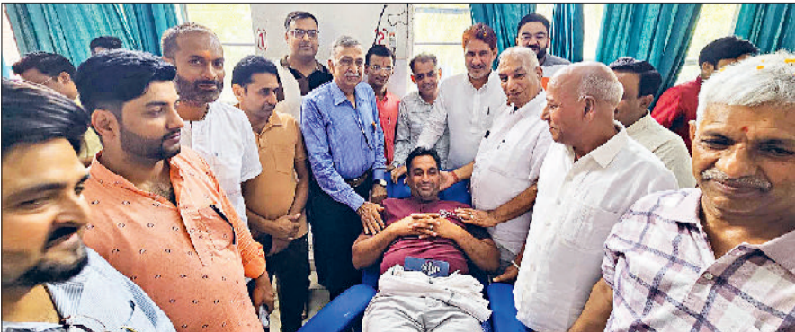
टोहाना। रक्तदाताओं को प्रोत्साहित करते सांसद सुभाष बराला।

उम्मीद चैरिटेबल ट्रस्ट, टोहाना द्वारा अपने तीसरे स्थापना दिवस के उपलक्ष्य में रविवार को विशाल रक्तदान शिविर का आयोजन किया गया। इस अवसर पर राज्यसभा सांसद सुभाष बराला मुख्य अतिथि के रूप में उपस्थित रहे और उन्होंने रक्तदाताओं का उत्साहवर्धन करते हुए ट्रस्ट की सेवा भावना की प्रशंसा